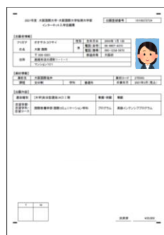
インターネット入学志願票