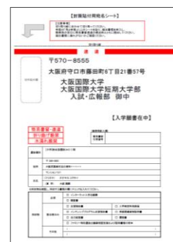
封筒貼付用宛名シート